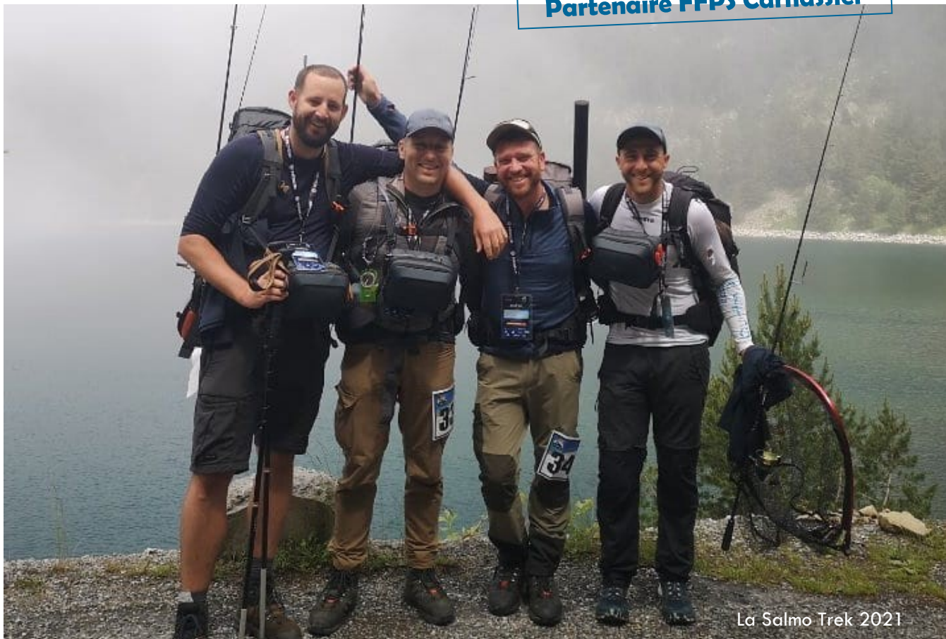
La Salmo Trek 2021